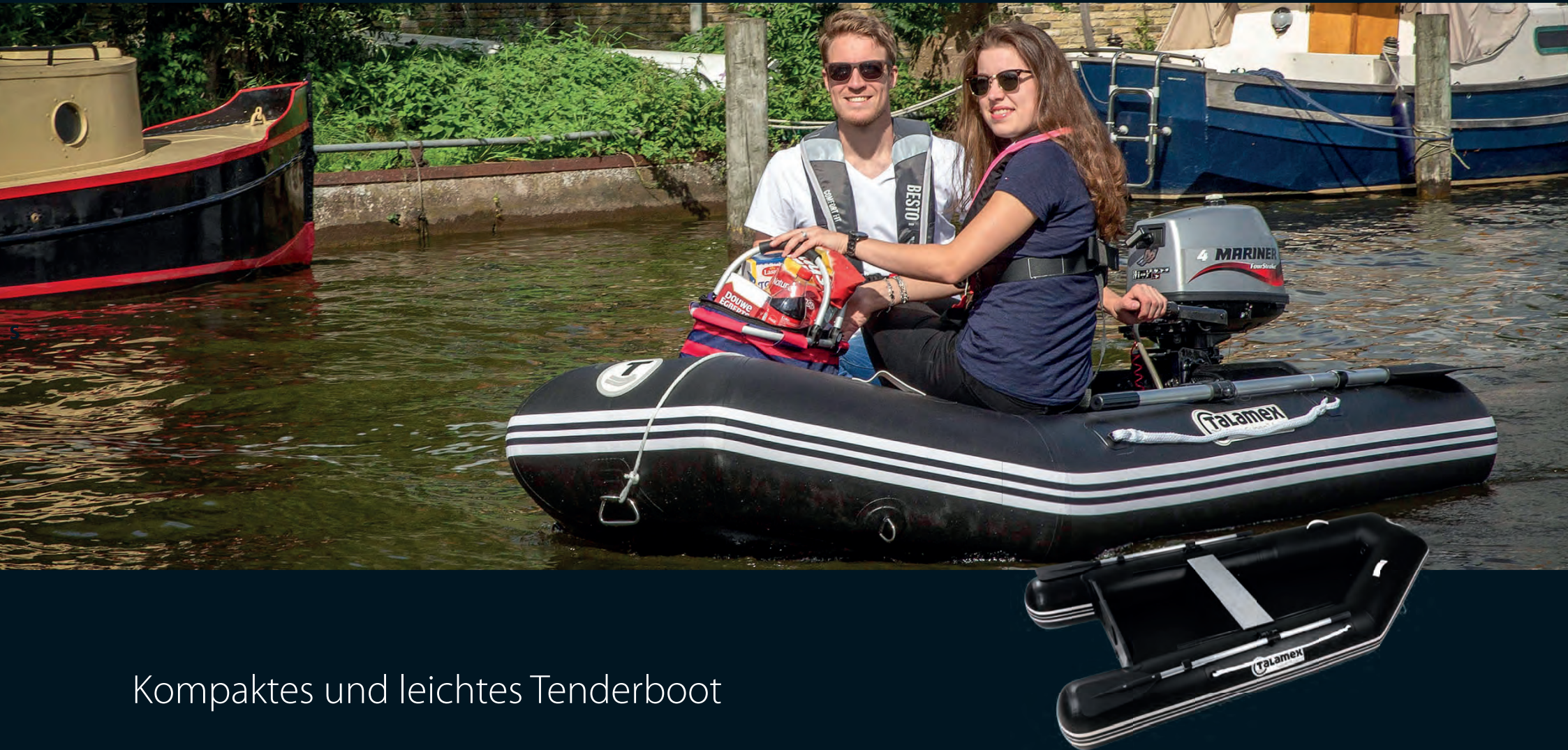
Kompaktes und leichtes Tenderboot